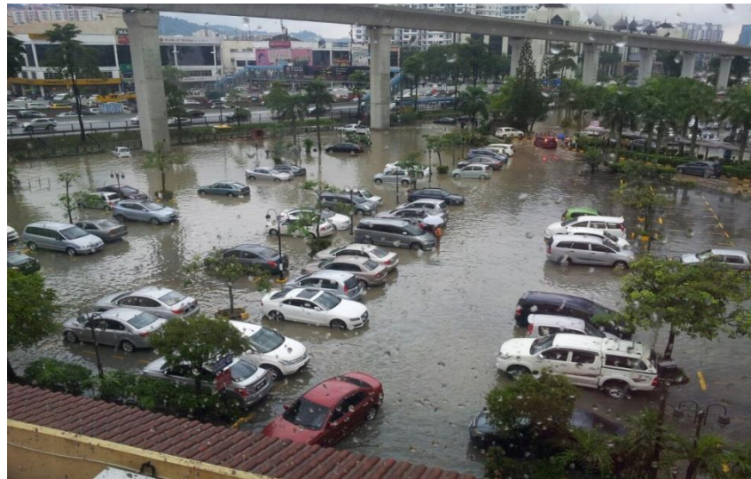
Banjir di LDP dan Bangunan IOI Mall