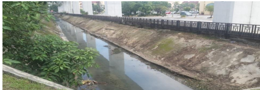
Kerja pembersihan kelodak/tumbuhan di dalam longkang utama (hadapan IOI Mall) telah siap dilaksanakan.