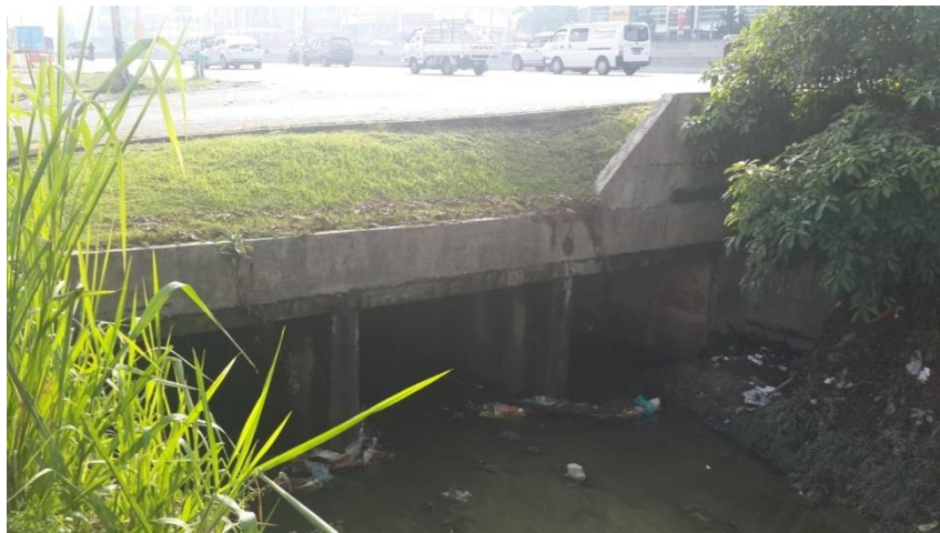
3 cell culvert di laluan masuk IOI Mall