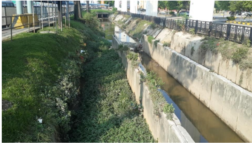
Kelodak/tumbuhan serta struktur konkrit di dalam longkang utama hadapan IOI Mall