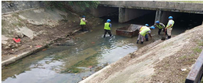
Keadaan semasa kerja pembersihan kelodak di dalam box culvert ( dalam tapak stesen 6 LRT) dan 3 cell culvert (laluhan masuk IOI Mall)